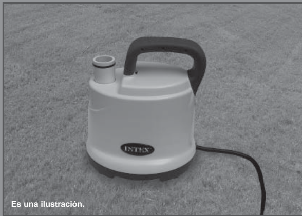
Es una ilustración.

No se olvide de probar otros productos Intex: Piscinas, Accesorios para piscinas, Piscinas inflables, Juguetes, Camas de aire y barcas están disponibles en nuestros distribuidores o visitando nuestra página web. Debido a una política de mejora continuada de producto, Intex se reserva el derecho a modificar las especificaciones y la apariencia, lo cual puede implicar cambios en el manual de instrucciones, sin previo aviso.